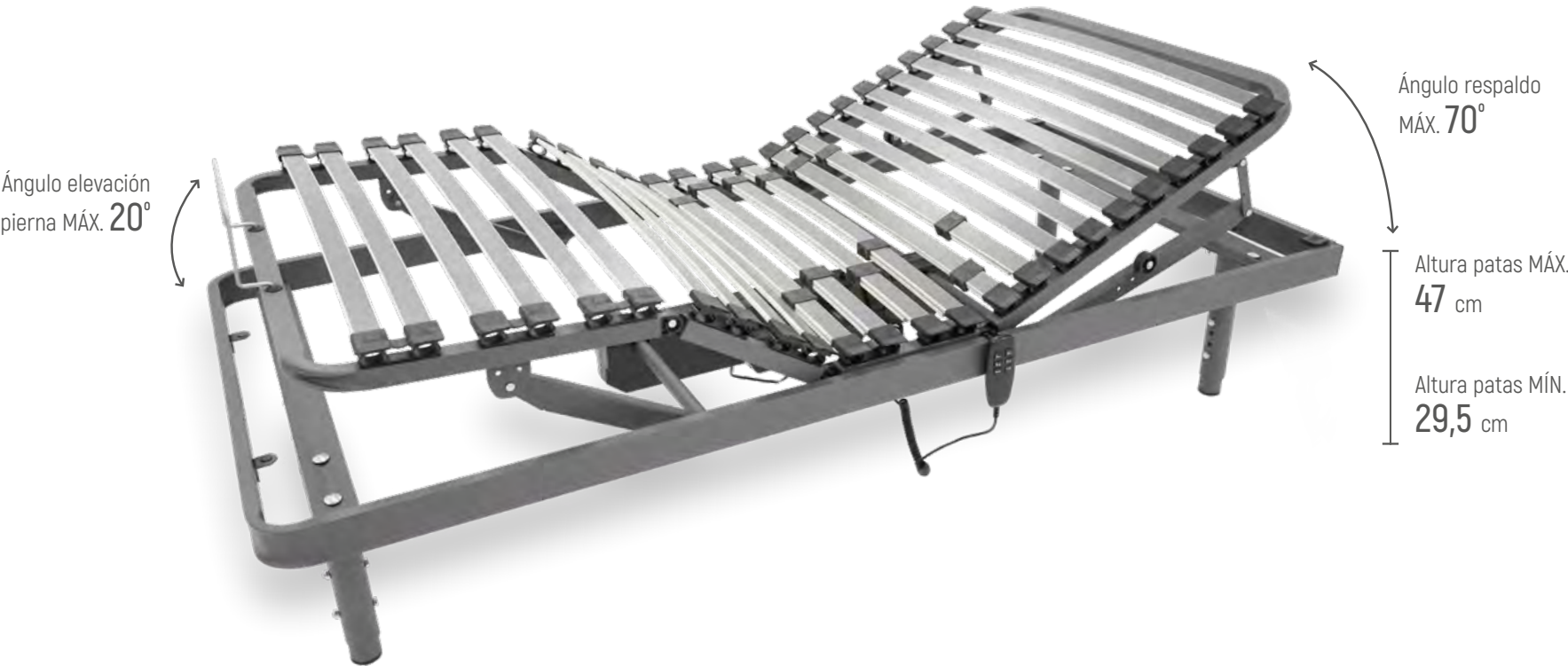
4 PLANOS ARTICULABLES